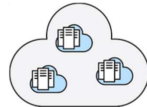
Virtual Private Cloud

Come vedete l'utilizzo di tecnologie di AI e Cognitive Computing